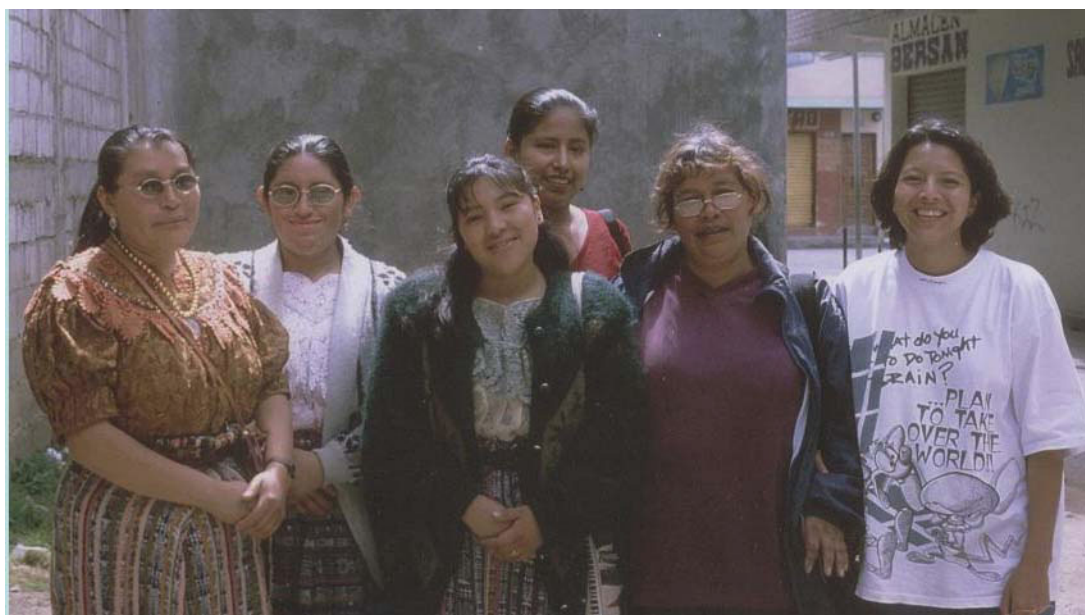
Stipendiatinnen aus Guatemala