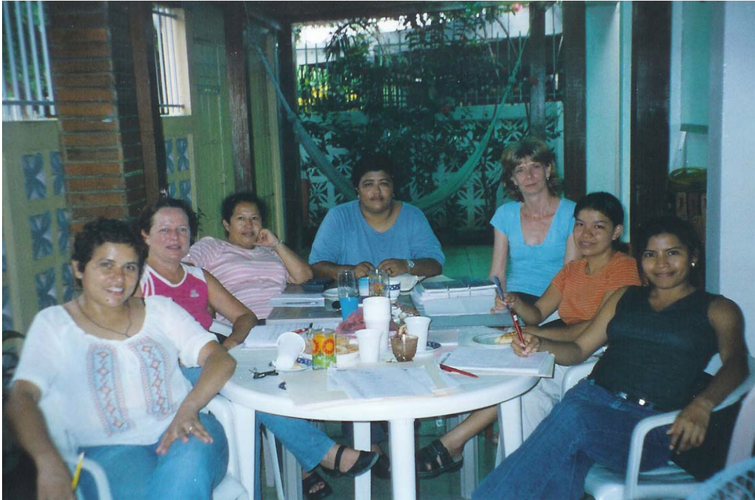
Sitzung der Stipendienkommission von MIRIAM-Nicaragua